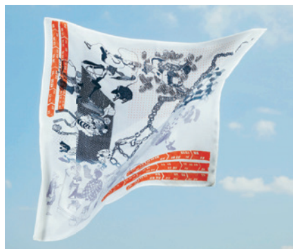
Noch eine Art der Fanfiction: Das Stuttgarter Label Kühnertová dreht die Geschichten von Haruki Murakami weiter, auf Seidentüchern.