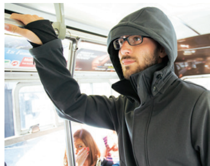
Diese Jacke von Betabrand soll vor Grippeviren schützen. Den Versuch dürfte es in diesem Winter wert sein.