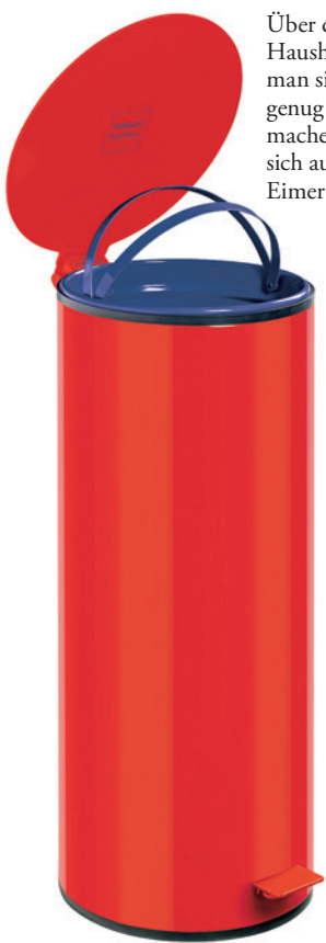
Über die Mengen an Haushaltsmüll kann man sich gar nicht genug Gedanken machen. Also lohnt sich auch ein schöner Eimer (Perigot).