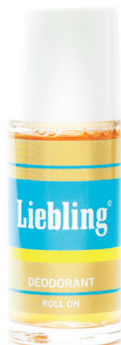
Deodorants müssen keinen 72-Stunden-Schutz versprechen. Liebling (über Julisis) duftet über den angemessenen Zeitraum eines Tages nach Zitronenmelisse.

Langes Studium und Kinder, das geht. Zwei Volkswirte haben es in Amerika herausgefunden. Frauen mit College-Ausbildung bekommen demnach 1,88 Kinder, Frauen mit höheren Abschlüssen 1,96.