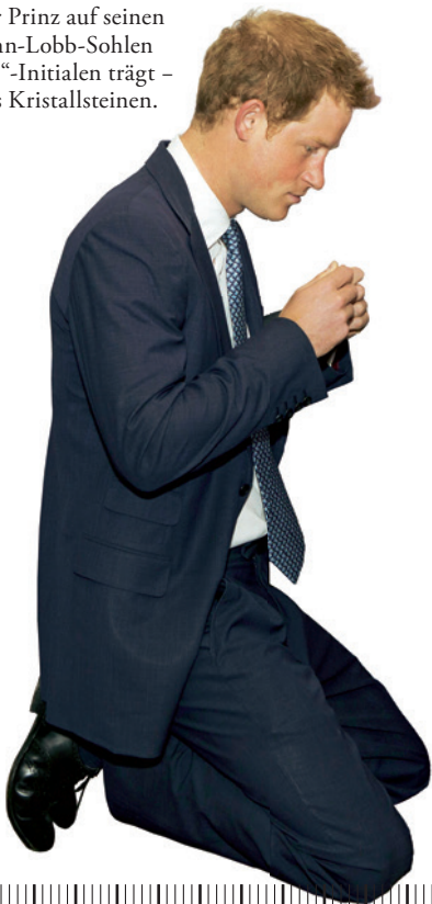
Prinzen wie Harry müssen sich öfter mal irgendwo hinknien. Bei dieser Gelegenheit vor einigen Wochen fiel auf, dass der Prinz auf seinen John-Lobb-Sohlen „H“-Initialen trägt – aus Kristallsteinen.