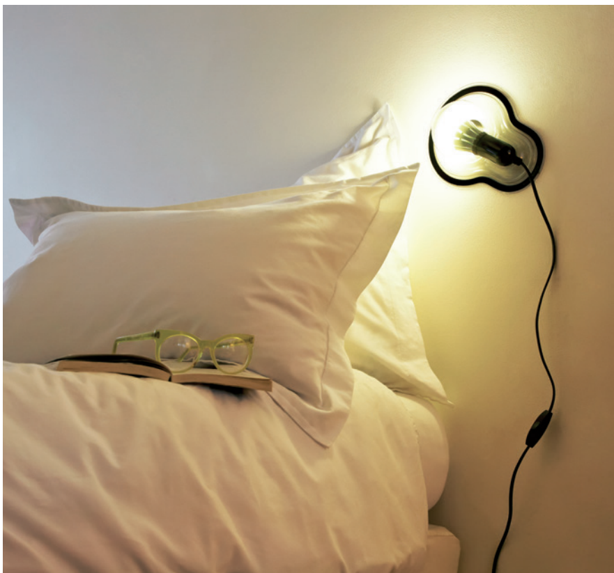
Vom Tageslicht ist zur Zeit nicht viel zu erwarten. Da macht die Sticky Lamp (Droog) einem das Lesen leichter. Wenn es dunkel wird, klebt man sie einfach an die Wand.